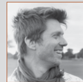
Mathieu Lippé Auteurs- compositeurs- interprètes