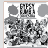
Gypsy Kumbia Orchestra Percussions afro-colombiennes