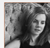
Joëlle Saint-Pierre Auteure- compositrice- interprète